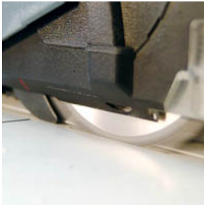
Saubere Tauchschnitte ohne Demontage des Spaltkeils mit MAFELL-FLIPPKEIL