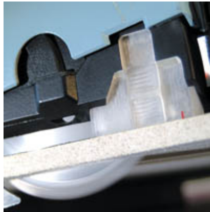
Die geschlossene Konstruktion wird durch den auf das Werkstück absenkbaren Klarsichtschieber zusätzlich optimiert.