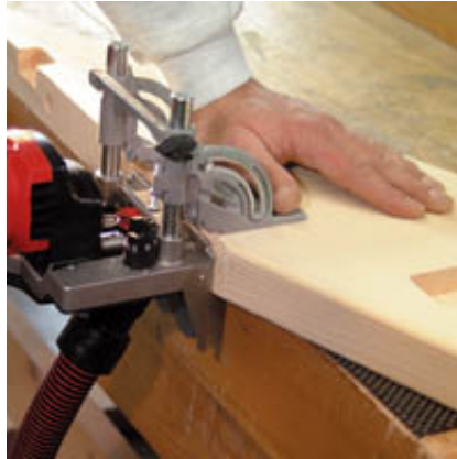
Arbeiten beim Treppenbau, in der Werkstatt oder auf Montageeinsätzen.